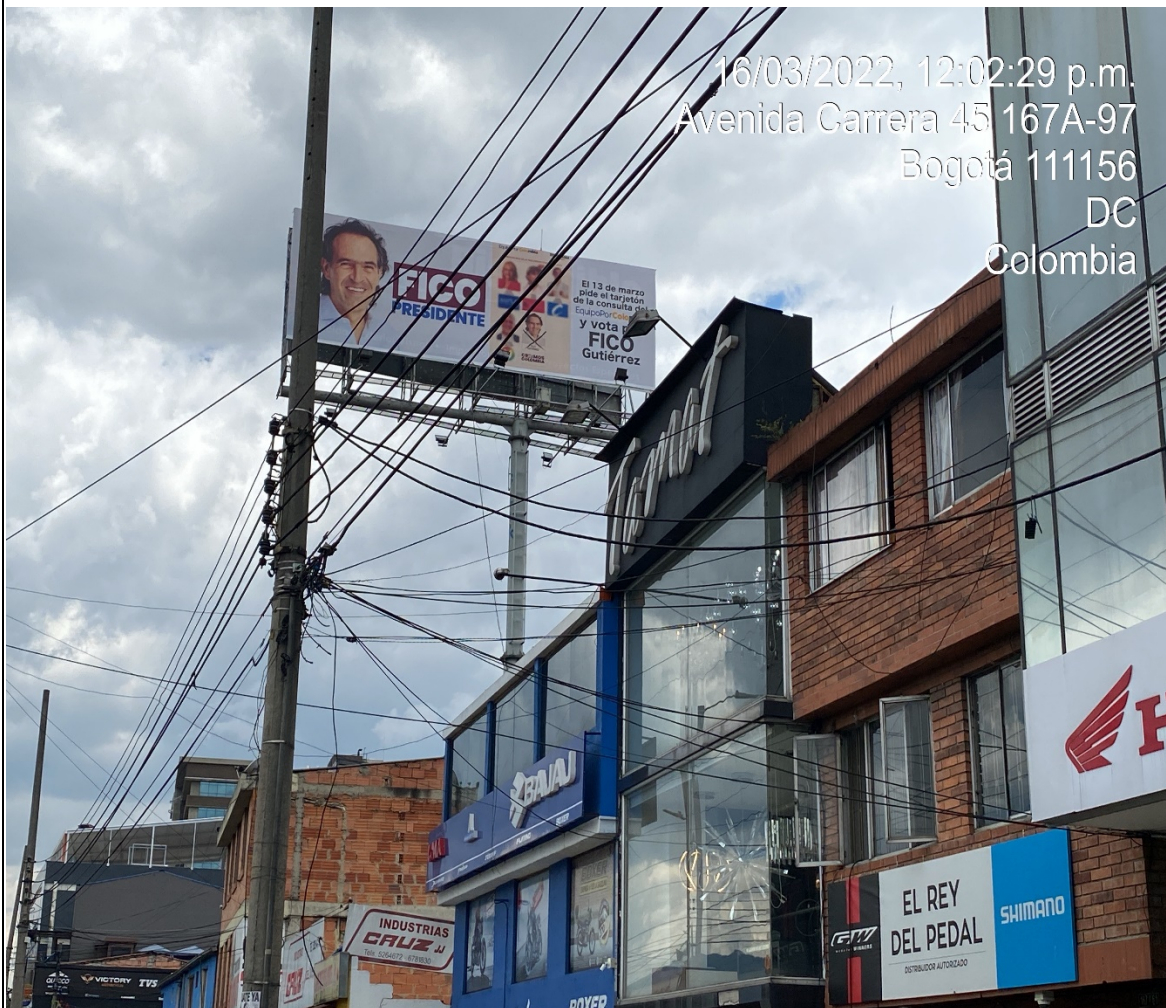
Foto Panorámica – Un (1) elemento tipo VALLA TUBULAR con publicidad política, con orientación visual NORTE - SUR sobre la KR 45, calzada occidental